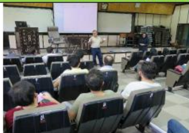
جلسه توجیهی قبل از روز برگزاری آزمون و تحویل کارت ورود به آزمون