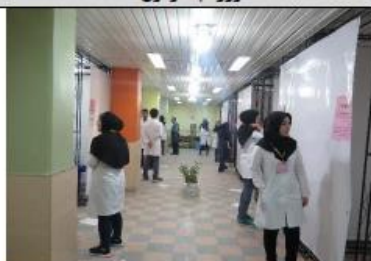
جرخشی بین ایستگاهها