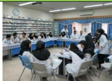
قرنطینه قبل از آزمون - صرف صبحانه