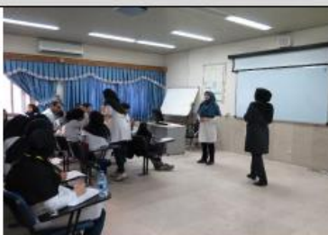
قرنطینه بعد از آزمون