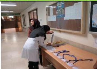
حضور غیاب و تحویل امانات